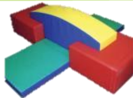
Модульный комплекс "Забава-5"