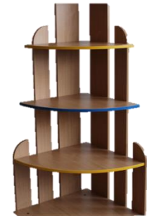
Стеллажи «Каскад» «Ступеньки»