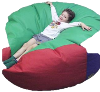
Детский пуф "Островок отдыха"