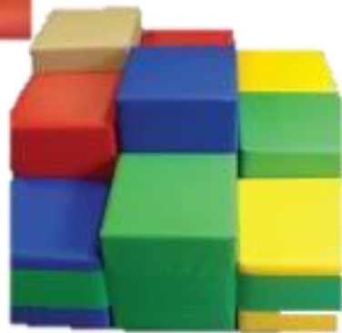
Набор мягких модулей "Валуны"