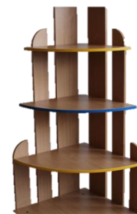
Стеллажи «Каскад» «Ступеньки»