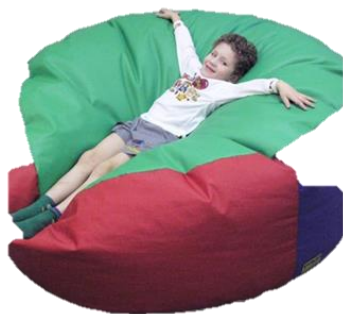
Детский пуф "Островок отдыха"