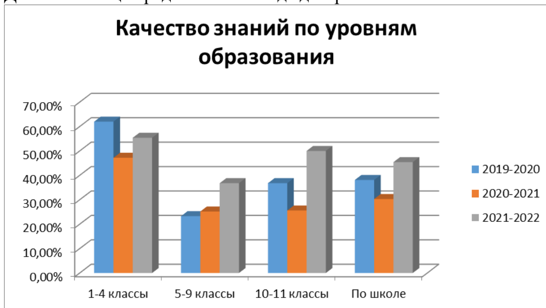
Диаграмма 2. Качество образования в динамике за три года.

Данная таблица представлена в виде диаграммы